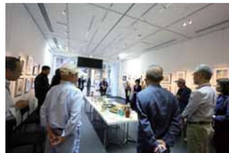
9/27(土) オープニングパーティーの様子